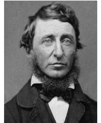
Henry D. Thoreau